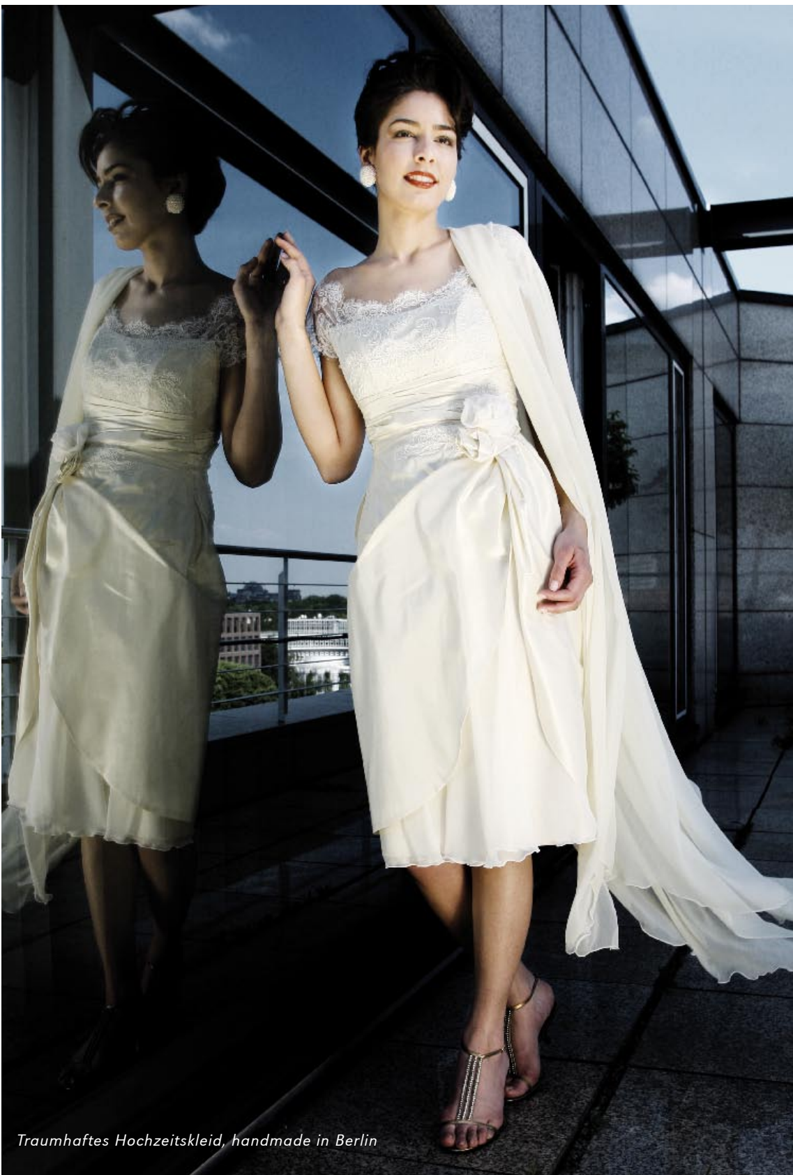
Traumhaftes Hochzeitskleid, handmade in Berlin

Die Fotos für diesen Artikel wurden im Grand Hotel Esplanade aufgenommen.