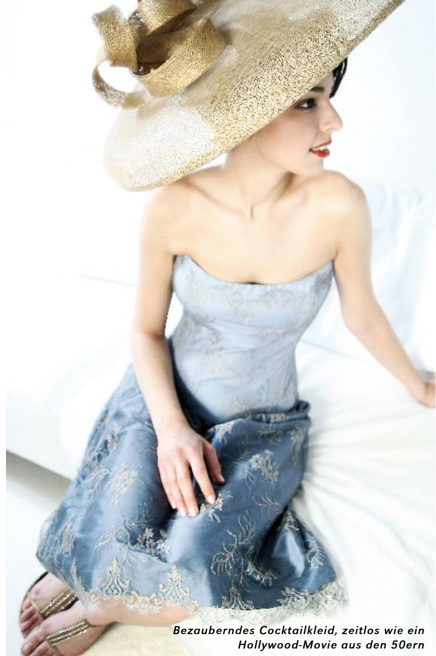
Bezauberndes Cocktailkleid, zeitlos wie ein Hollywood-Movie aus den 50ern

Das wird in der Presse propagiert, unter dem Motto „Das musst du in dieser Saison kaufen.“ Eine puristische Frau werden Sie niemals zu einer Barockelfe machen, nicht mal durch eine Modewelle. Deswegen kommen die Kundinnen gern zu mir: Sie wollen sich nicht diesem Diktat des Einzelhandels unterwerfen. Wenn eine Frau zu mir kommt und fragt: „Welche Farbe trägt man denn in dieser Saison?“, dann antworte ich ihr: „Die, die Ihnen steht.“